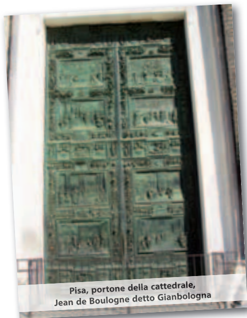
Pisa, portone della cattedrale, Jean de Boulogne detto Gianbologna

Nel '500 Giambologna esegue le porte della facciata del Duomo di Pisa. Alla fine dell'800 risale la porta del Duomo di Milano di L. Pagliaghi. Nella Basilica di S. Pietro la "porta della morte" fu commissionata nel 1964 da Papa Giovanni XXIII al Manzù: da questa porta escono i cortei funebri dei Pontefici. Negli ultimi decenni si è tornati a progettare portali con forte carica simbolica. In occasione del Giubileo del 2000 è stato realizzato il portale della Cattedrale di Terni a opera dell'artista Bruno Cecconi.